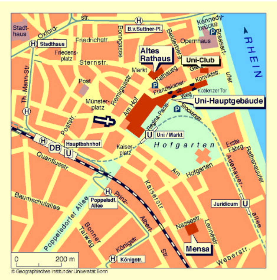
Karten II & III